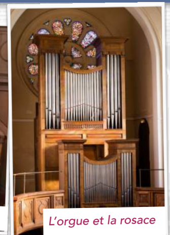
L'orgue et la rosace