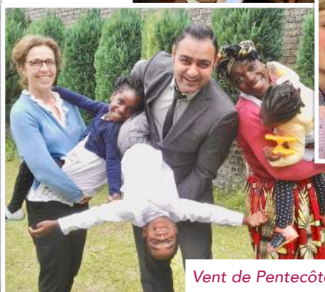
Vent de Pentecôte !