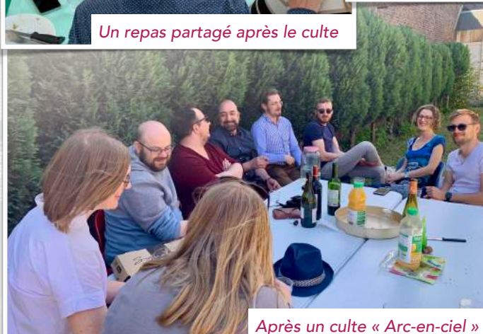
Après un culte « Arc-en-ciel »

Chaque année, l'Assemblée générale décide du budget et des grandes orientations