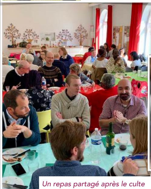
Un repas partagé après le culte