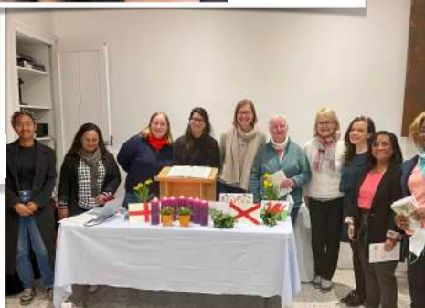
L'équipe de la Journée mondiale de prière