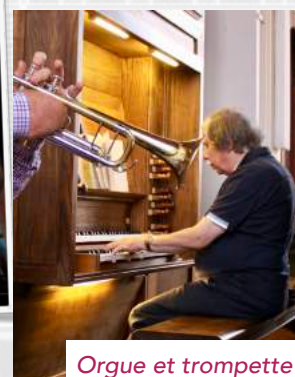
Orgue et trompette