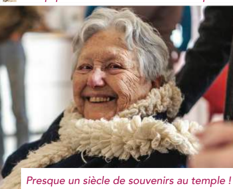
Presque un siècle de souvenirs au temple !