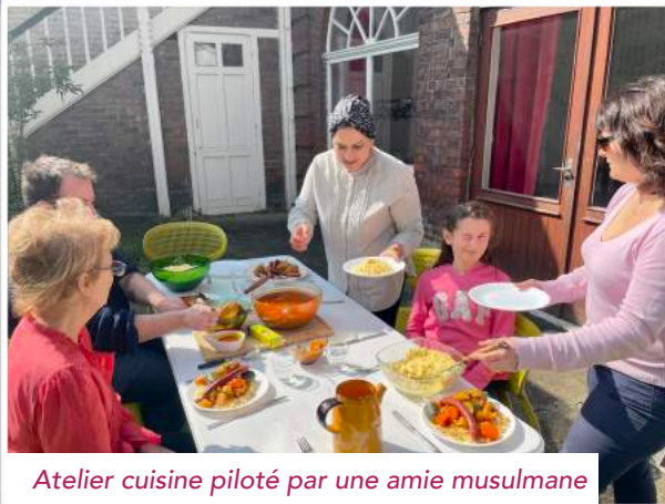
Atelier cuisine piloté par une amie musulmane