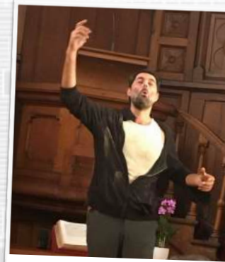
Le comédien Eram Sobhani