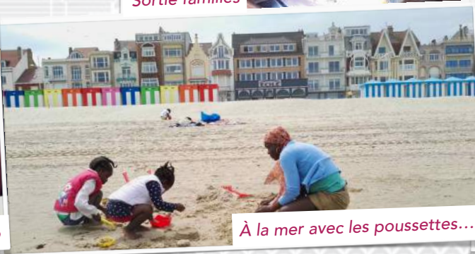
À la mer avec les poussettes...