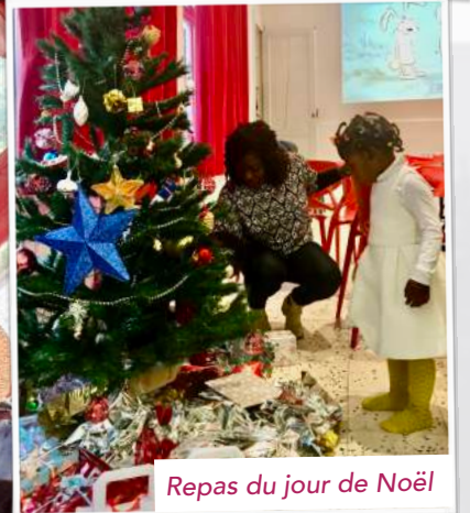
Repas du jour de Noël