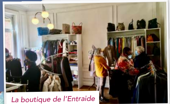
La boutique de l'Entraide

« La boutique de l'Entraide » et les activités solidaires sont ouvertes à tous.