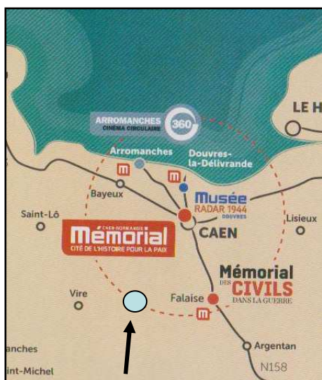
Condé sur Noireau